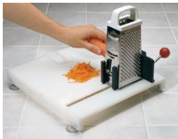
Flere typer kjøkkenutstyr