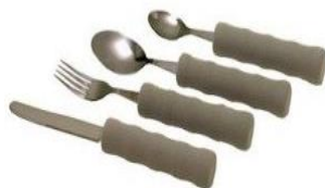
Bestikk, flere typer