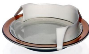
Tallerkenkant i plast