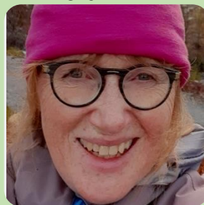
PEDAGOGISK LEIAR/ SPESIALPEDAGOG